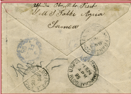
839 - 2.1.1895, einzig bekannter Brief mit doppelter Barfrankierung aus Deutsch Samoa mit US Nachfrankierung nach China.