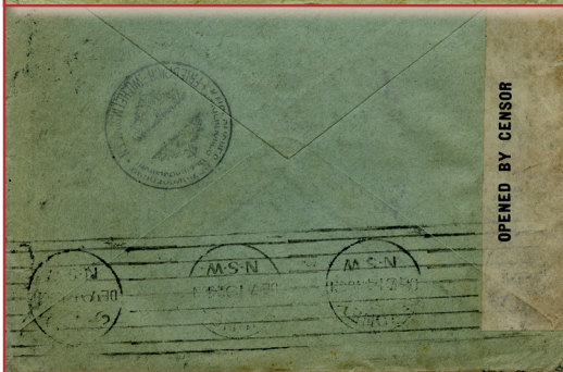
282, 18.10.1914, Brief nach Finschhafen, DNG: trotz Kriegsausbruch durch die australische Zensur gelaufen und noch ausgeliefert!