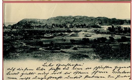
356, 23.01.1904, Dampferentwertung auf dem Viktoriasee: handschriftliche Strichentwertung wegen fehlender Schiffspostausrüstung & R-Zettel "Mpapua" via DES nach BERLIN