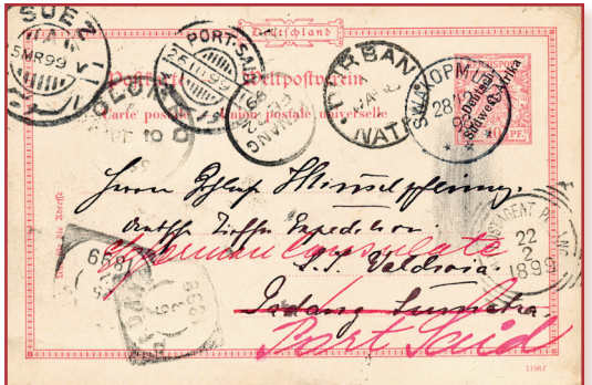
619 - 28.12.1898, "...Deutsche Tiefsee Expedition / S.S. Valdivia Expedition / Pedang Sumatra"

833 - 12.02.1896: Butaritari Atoll, Gilbert Inseln