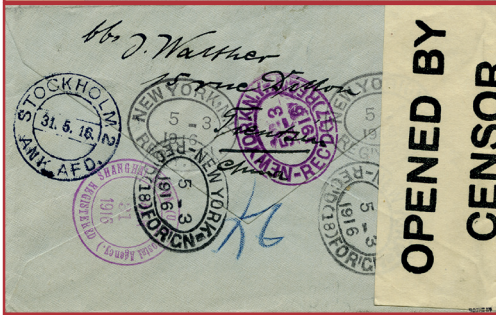
107 - 1916, zensierter R-Brief aus Tientsin über Amerika nach Stockholm