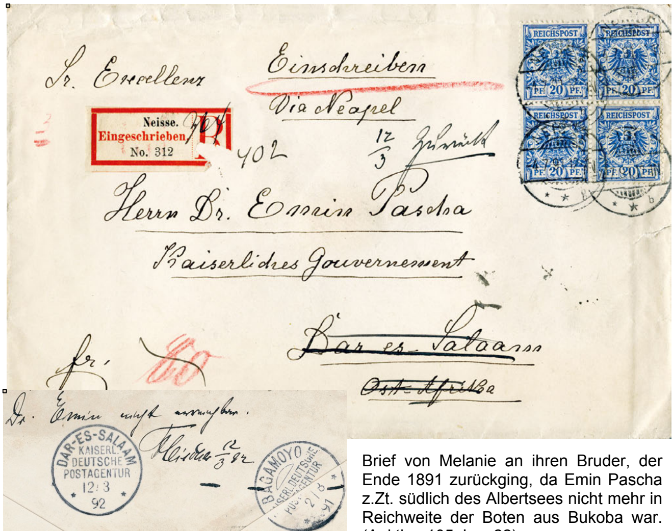
Brief von Melanie an ihren Bruder, der Ende 1891 zurückging, da Emin Pascha z.Zt. südlich des Albertsees nicht mehr in Reichweite der Boten aus Bukoba war. (Auktion 105, Los 22)

Dieses Unternehmen wurde jedoch durch Unstimmigkeiten zwischen Emin und dem stellvertretenden Reichskommissar Schmidt einerseits - und Nachrichten über Kämpfe seiner früheren Sudanestruppen nördlich des Albert-Edwardsees andererseits 4 - nicht beendet und am 22.3.1891 marschierte Emin aus Kadjuga Wussissi ab um die Ordnung in Äquatoria wieder herzustellen. Am 2. April 1891 setzte die Expedition im Nordwesten des Schutzgebiets über den Kagera, wo die letzte Post - die Anfang Dezember 1890 von der Küste abging - noch zugestellt wurde 5 . Danach ging Post an Emin Pascha zurück.